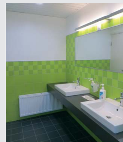
Naistenõuand- la teisel korrusel on personalile ehitatud ilus laimiroheline tualettruum. Sarnast tualetti oodatakse pikisilmi ka nõuandla esimesele korrusele.