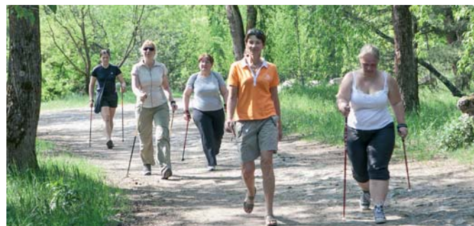
Tänavu mais toimunud tervisepäeval sai sammulugemisvõistlus välja kuulutatud, olgugi et tol korral lahtise kuupäevaga.

Ja nii need sammud tulevadki – eks ikka samm sammu haaval. Natuke kannatust ja peagi saab tiir ümber maakera tehtud.