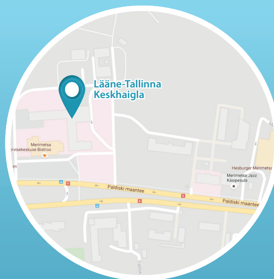
Lääne-Tallinna Keskhaigla Paldiski mnt 68, 10617 Tallinn

Voodipäevatasu maksmine toimub vastavalt hinnakirjale.